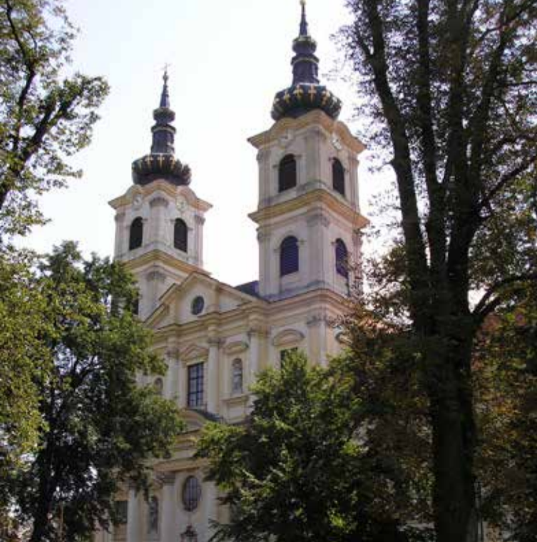
Bazilika Sedembolestnej Panny Márie, Šaštín-Stráže