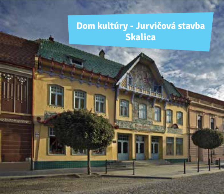
Dom kultúry - Jurvičová stavba Skalica

Pokračujeme ďalej na západ, okrajom miňeme Malé Leváre a prídeme do Gajar a cez Kostolíše prichádzame do Malaciek. Tu si môžeme prezrieť Pálffyovský kaštieľ s parkom, komplex frantiskánskeho opevneného kostola s kláštorm na námestí alebo židovskú synagogu. Pokračujeme ďalej do Plaveckého Štvrtka, Lábu a Zohora. Tu križujeme Malokarpatskú cyklomagistálu a prichádzame do Devína, kde trasa pod povestami opradenom hrade končí.